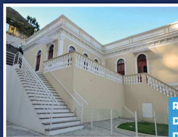
REABERTURA DA CASA PORTO DAS ARTES PLÁSTICAS

Secretário da Controladoria Geral do Município